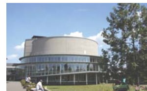
富士見市民文化会館/キラリ☆ふじみ