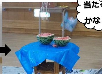
結局割れず スタッフの手で