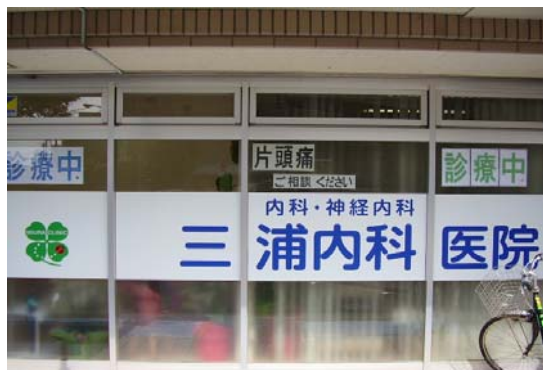
院長 三浦 孝顕

地域に根ざした医療を目指しております。医院の周辺にお住まいの方などお気軽にご相談ください。