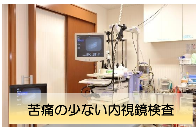
苦痛の少ない内視鏡検査