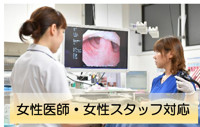
女性医師・女性スタッフ対応