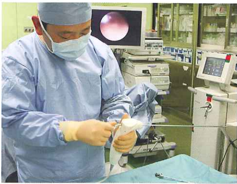
モーセレーターを取り替えているところ

に影響をおよぼすことなく目的の箇所を的確に焼き切ります。③的確に核出する(くり抜く)ので残存組織が少なく、再発の可能性が極めて低い。とまあ、こんなところですか(笑)。