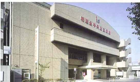
医療法人財団 明理会 明理会中央総合病院 〒114-0001 東京都北区東十条3-2-11 TEL.03-5902-1199(代表) http://www.ims.gr.jp/meirikaichuo/

(笑)、尿道が痛いとか、色がついているときは控えめにする、ということですね。——予防法はありますか? 前立腺肥大の方の検査では、血糖値の高い人が多い。糖尿病ともかなり強い関係にあり、肉や油をひかえたバランスの良い食事、適度の運動、十分な睡眠などメタボリックにならない生活習慣が何よりです。何か不安や疑問があったら、いつでもどうぞ! いきなり手術は勧めませんから(笑)。——本日はありがとうございました。