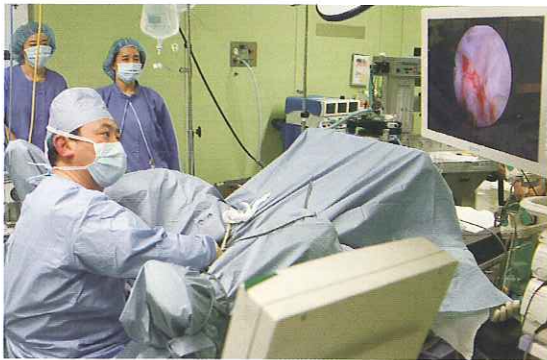
HoLEP(ホルミウムレーザー前立腺核手術)

それはいいですね。発生の仕組みが違いますから。前立腺は、外側の外腺と中側の内腺に分かれますが、肥大は内腺に、がんは外腺にできやすいですね。もちろん、内腺にもがんはできますが、多くはないです。