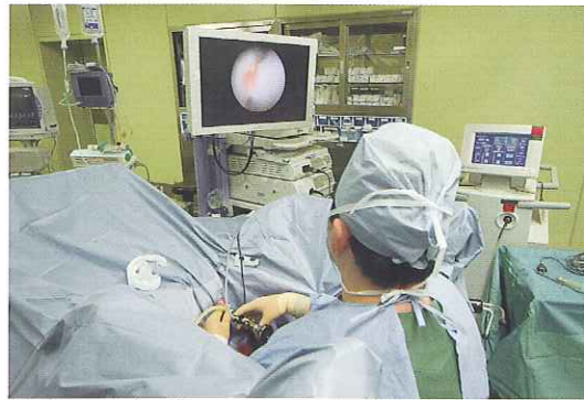
モニタを見ながら手術

に影響をおよぼすことなく目的の箇所を的確に焼き切ります。③的確に核出する(くり抜く)ので残存組織が少なく、再発の可能性が極めて低い。とまあ、こんなところですか(笑)。