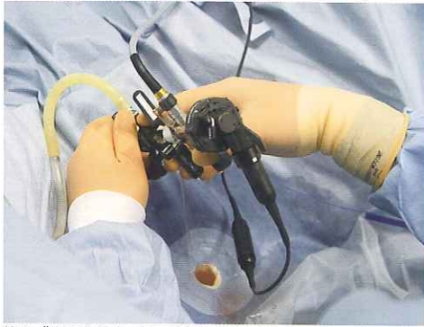
絶えず生理食塩水で洗い流す。細くて青いワイヤーがレーザー