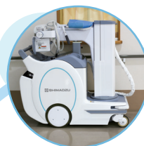
ポータブル装置 (島津)