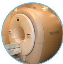
1.5T MRI装置 (Canon)