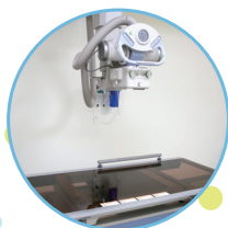
一般撮影装置(日立) FPD(コニカ)