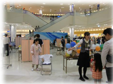
看護フェスティバル～5月頃～