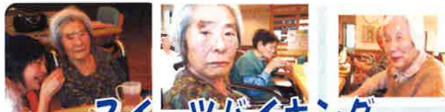
スイーツバイキング