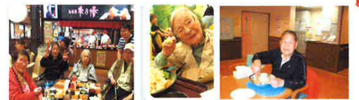
杜の市場 おやつ作り

5月は杜の市場へ行って来ました。時間が過ぎるのも忘れ、楽しく過ごしました。 4月はおやつ作りを行いました。手作りのおやつは格別だったようで、皆様笑顔で召し上がっていました。