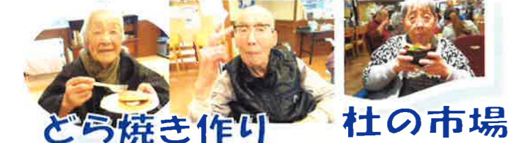
どら焼き作り 杜の市場

4月は杜の市場で美味しい海の幸に舌鼓♪ 5月おやつ作りとして「どら焼き作り」を行いました。「おいしい！」と大好評でした♪