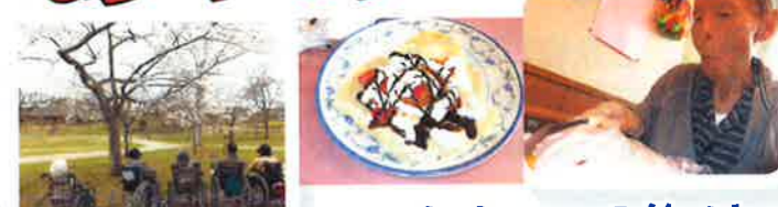
みちのく湖畔公園