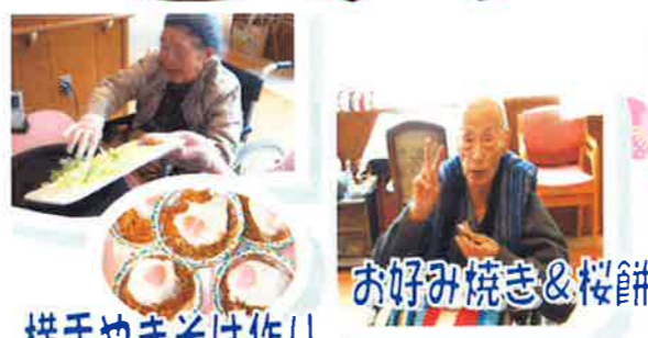
横手焼きそば作り