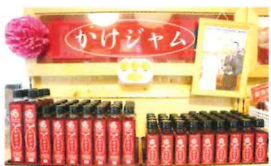
越谷産のいちごを使った「かけジャム」もおすすめです♪