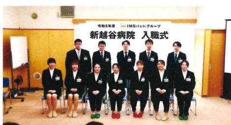
リハビリテーション科 新入職者