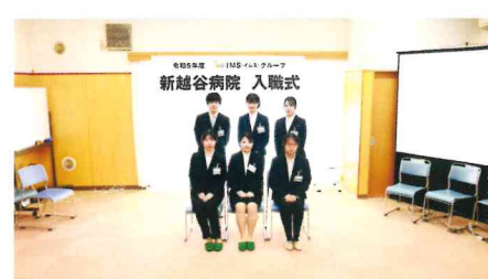
栄養科・SW・事務 新入職者