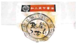
人気商品の「越谷ふあり」