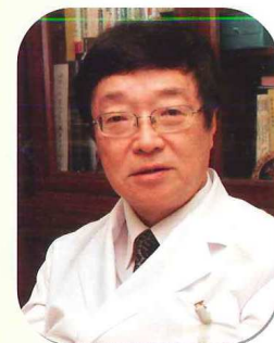
鶴川サナトリウム病院

COPDとは聞きなれない名前ですが英語の Chronic Obstructive Pulmonary Disease (慢性閉塞性肺疾患)の頭文字をとったもので、これまで慢性気管支炎、肺気腫、と言われていた病気を合わせてこのように呼ぶようになった名称です。慢性気管支炎も肺気腫も徐々に慢性の炎症が肺に進行し、空気の流れ道に障害を起こし流れにくくなります。このため息が吐き出しにくくなり(閉塞性換気障害)呼吸が苦しく、ADL(日常生活動作)の低下をきたすようになります。症状や治療の共通点が多いためこのような状態をCOPDと言います。