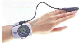
パルスオキシメータ

COPD の診断は病歴、肺機能検査、X線検査、CT検査、パルスオキシメータなどで総合的に行われます。肺機能検査では一秒率(息を勢よく吐き出した時、最初の1秒間に吐き出せる息の量の割合)70パーセント未満でCOPD以外の明らかな病気がない時、COPDと判断されます。X線検査では進行すると、肺に空気がたまることにより肺が大きくなる(過膨張)所見が見られます。パルスオキシメータは皮膚に装置をあてるだけで血液中の酸素飽和度を測定するもので、肺から血液への酸素の供給状態がわかります。血液を採取して測定する酸素分圧を見る方法より正確度は若干劣りますが、自分の体を自分自身でモニターするのに便利です。