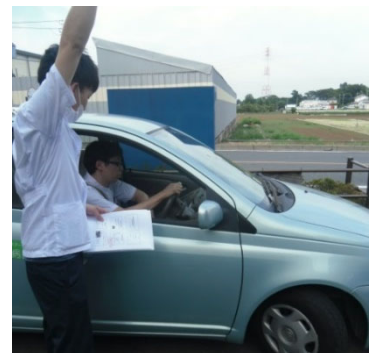
実際の車に乗ってハンドル操作等の確認を行います。