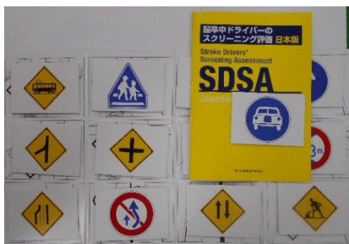
運転に関する高次脳機能検査を行います。