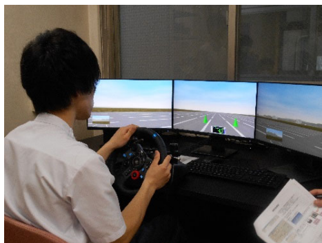
自動車シミュレーターを使用します。