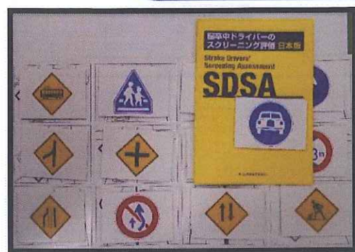
運転に関する高次脳機能検査を行います。