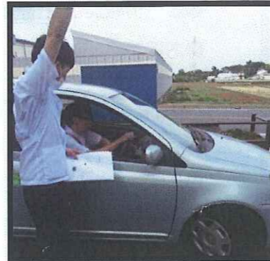
実際の車に乗って ハンドル操作等の確認を行います。