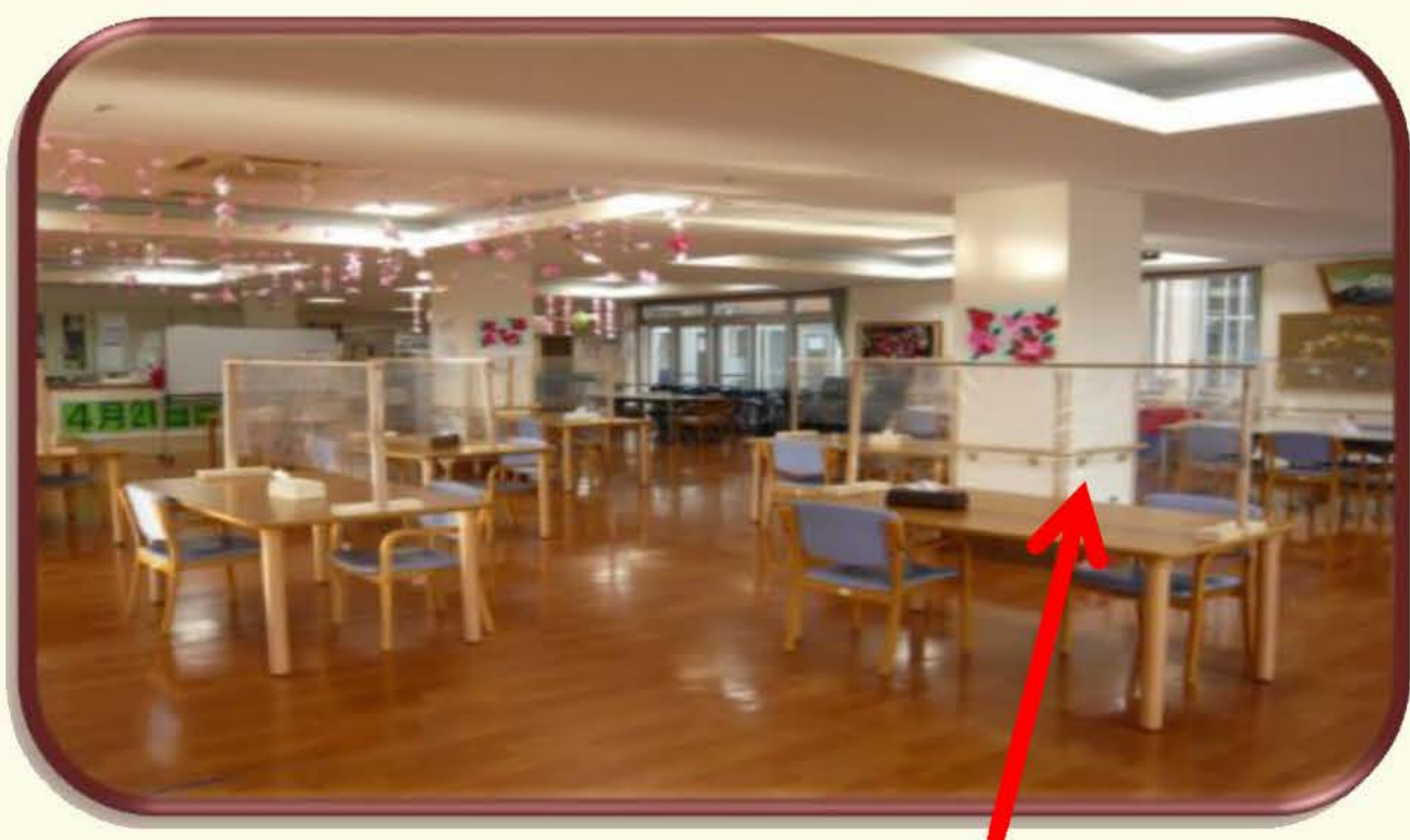
飛沫感染予防で スクリーン の設置