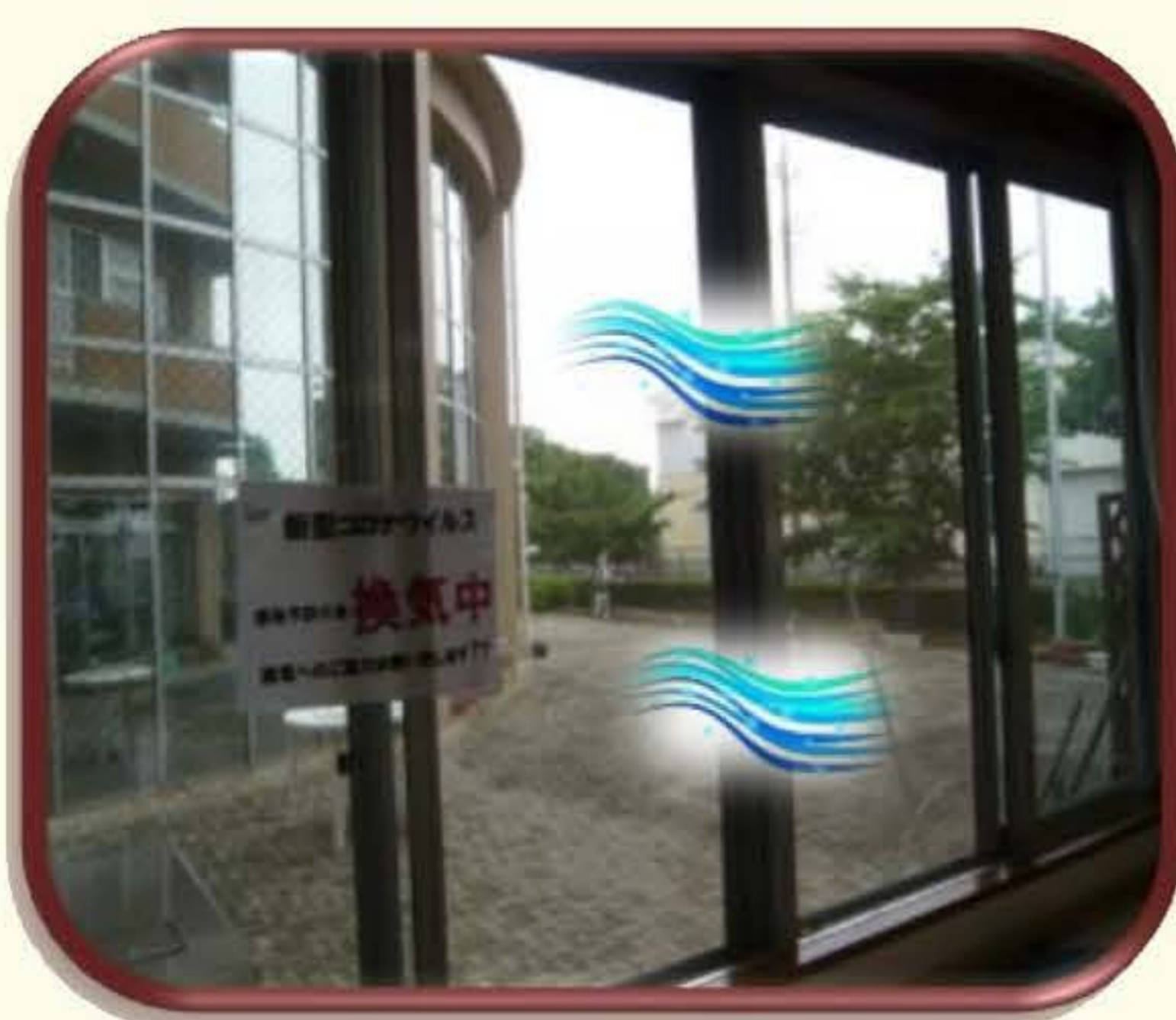
随時、 換気 を行っています