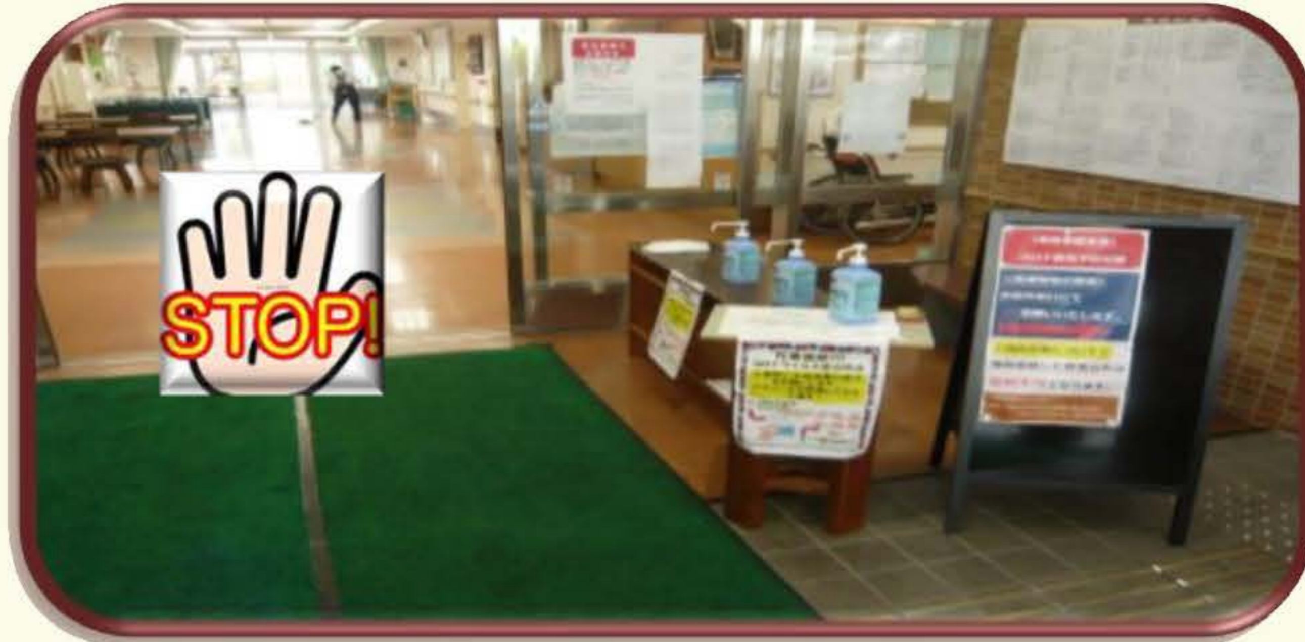
施設到着時、 検温・手指消毒 します